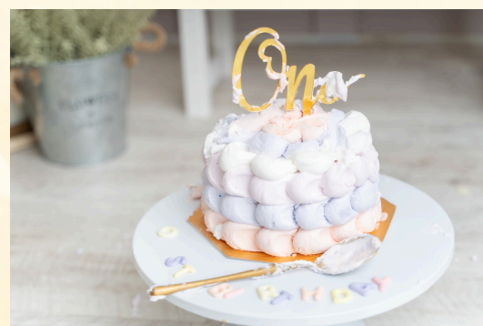
クリームカラー例